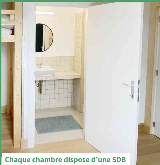
Chaque chambre dispose d'une SDB