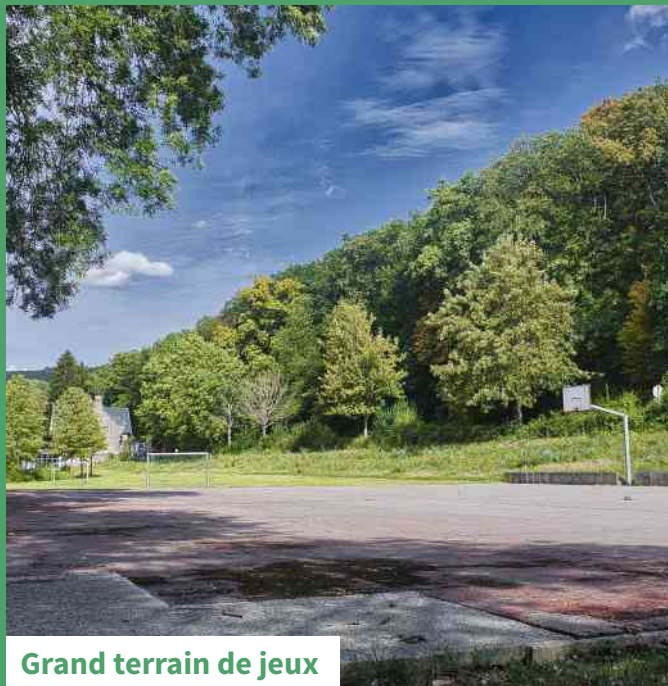
Grand terrain de jeux