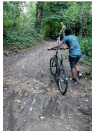
Avontuur in de bossen