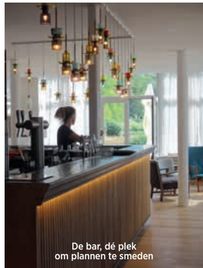
De bar, dé plek om plannen te smeden