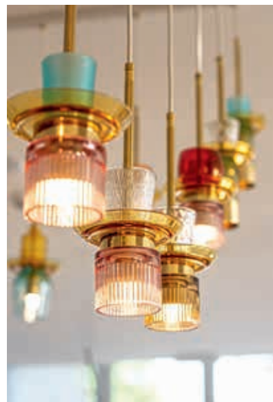
Het hotel is kleurrijk gestyled