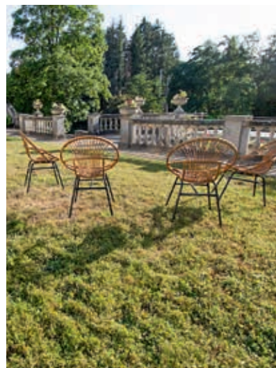
Zalig relaxen in de tuin met extra eiland