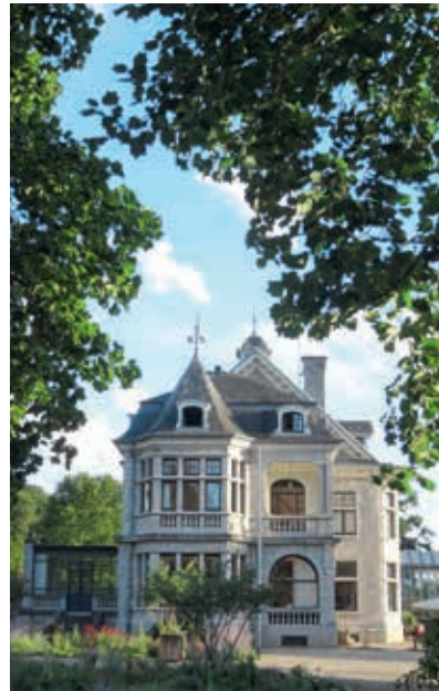
Les Sorbiers, op een domein van 17 hectare

VANAF SEK 4.288 / € 415 VOOR 2 PERSONEN. ARCTICBATH.SE