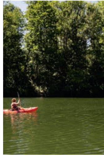
Kajakken kan voor de deur